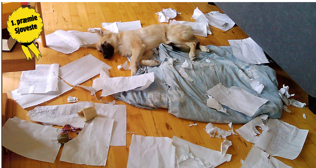
Efter en hård dag på arbejdet er det tid til en lur... Vi har valgt dette foto, fordi det viser, hvad det også vil sige at have hund.

Vuffelivauw. Hvordan vælger man de bedste skud ud af 2857 fotos? Vi bad fotograf Tine Harden og skribent Maise Njor, der sammen har udgivet blandt andet bogen »Sit! Fortællinger fra et hundeliv« – om hjælp til at kåre vinderne i vores fotokonkurrence