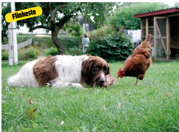
Faktisk burde prisen gå til hønen. Den må være verdens modigste stykke fjerkræ.