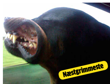
Hunde, forklar os lige. Hvad er det, der er så fedt ved at stikke hovedet ud ad en hurtigtkørende bil?!