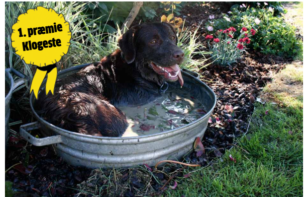
Lauritz har så klart forstået at få sig en kølende dukkert uden sine menneskers hjælp. Men hvornår lærer hunde at betjene en barbermaskine, så de kan få pelsen af om sommeren?