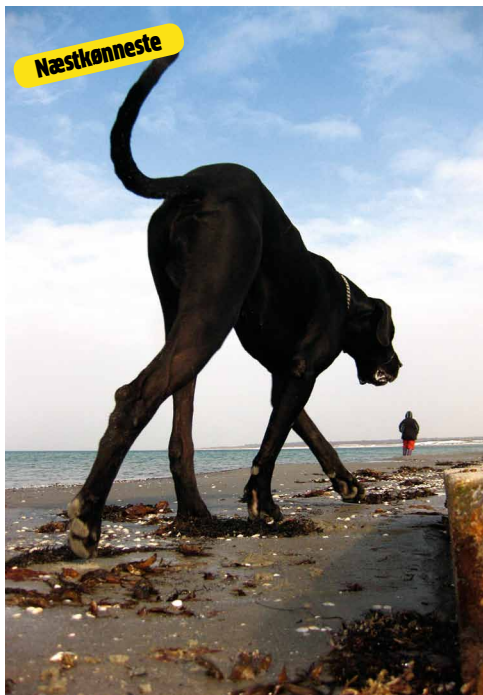
Den ligner jo nærmest en skulptur af Robert Jacobsen. Man kan så være lidt bekymret for fotografens mentale helbred. Hvem lægger sig og mosler nede i vådt sand for at tage billede af sin hund?